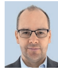
Christian Magistra N.9